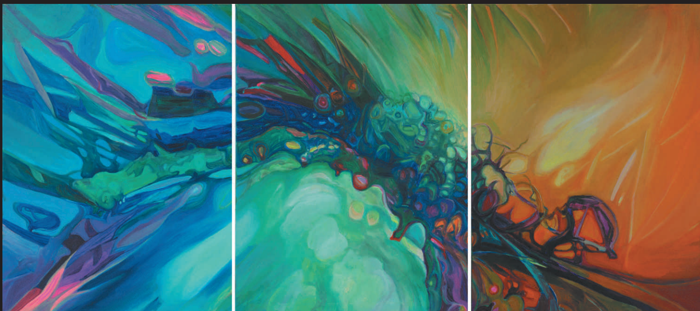
MARIANNA GRABOWSKA „BEZ TYTUŁU”, ol./pł, 70 x 50 cm, /x4/, 2015