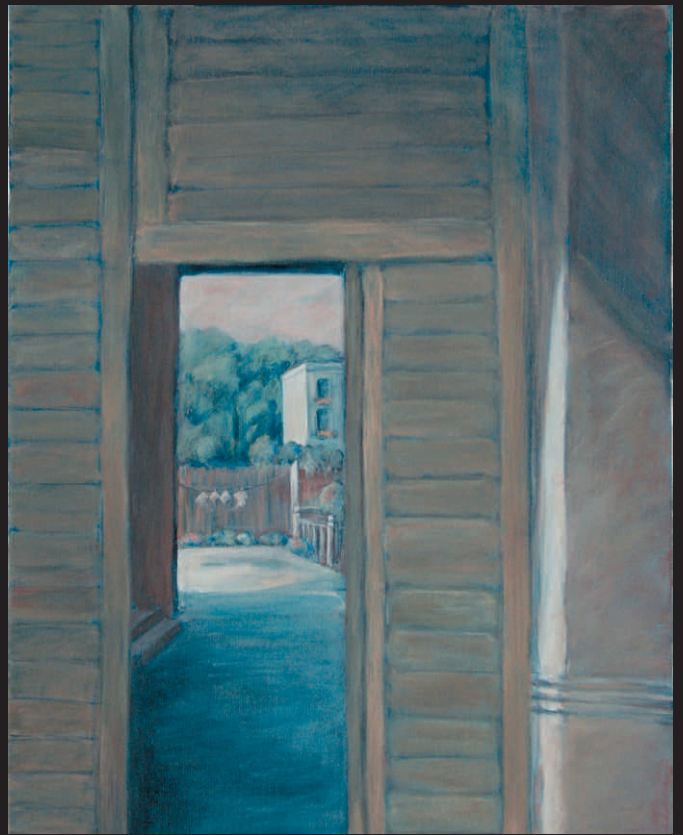
NINA BADOWSKA „WGLĄD PRZEZ BRAMĘ”, ol./pt., 70 x 50 cm,/x2/, 2015