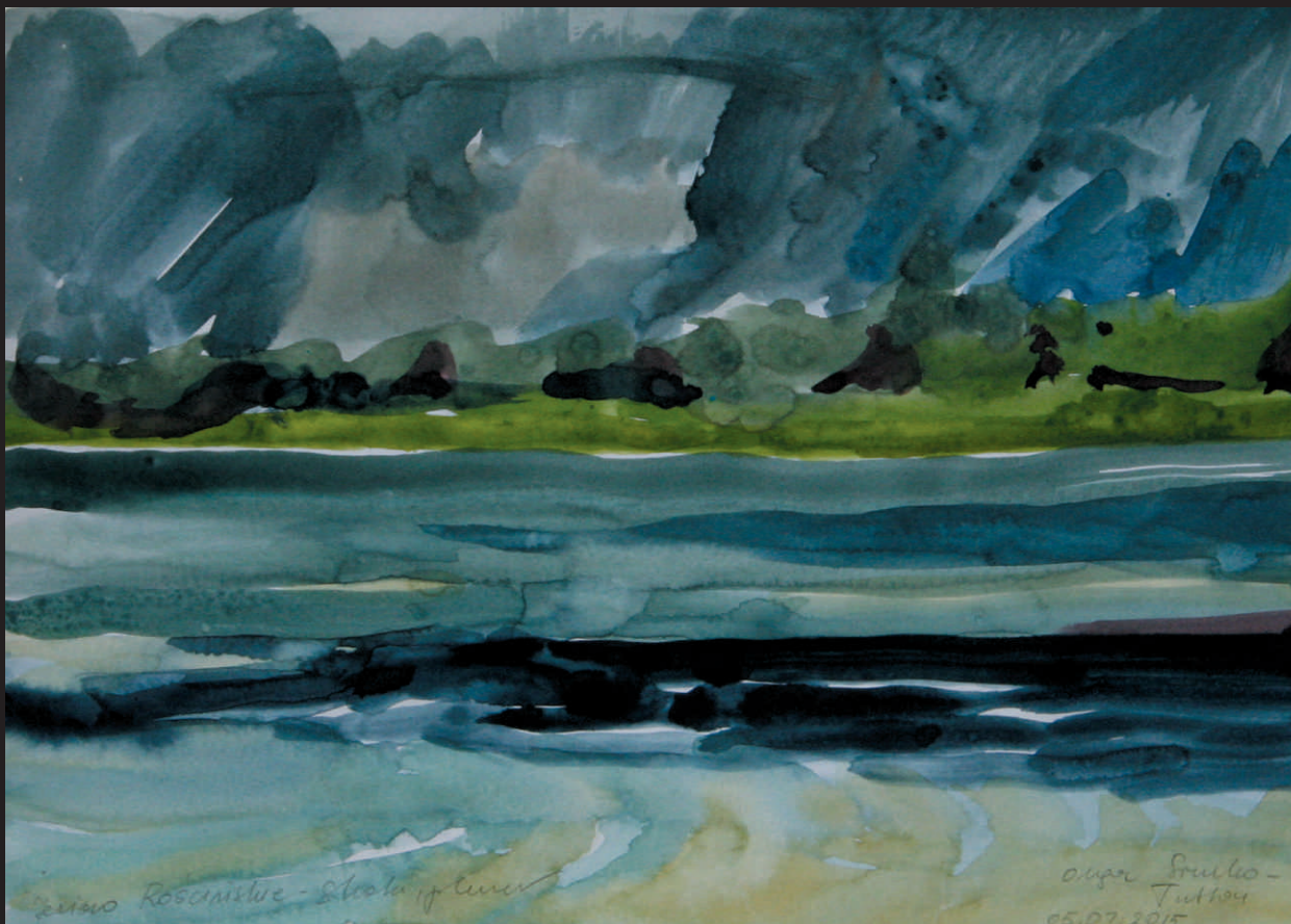
OLGA SIENKO TUTTON „JEZORO ROŚCIŃSKIE”, akwarela/pap., 29,6 x 42,2 cm, 2015