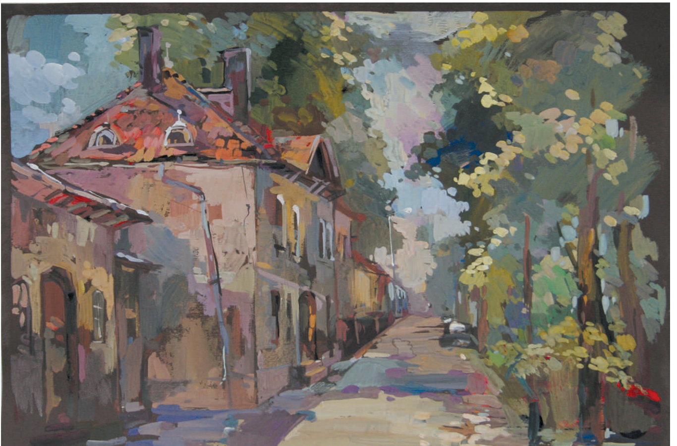
OLGA DANIŁOWNA BUKHOWKA „DWORZEC W SKOKACH”, tempera/pap., 35 x 50 cm, 2015