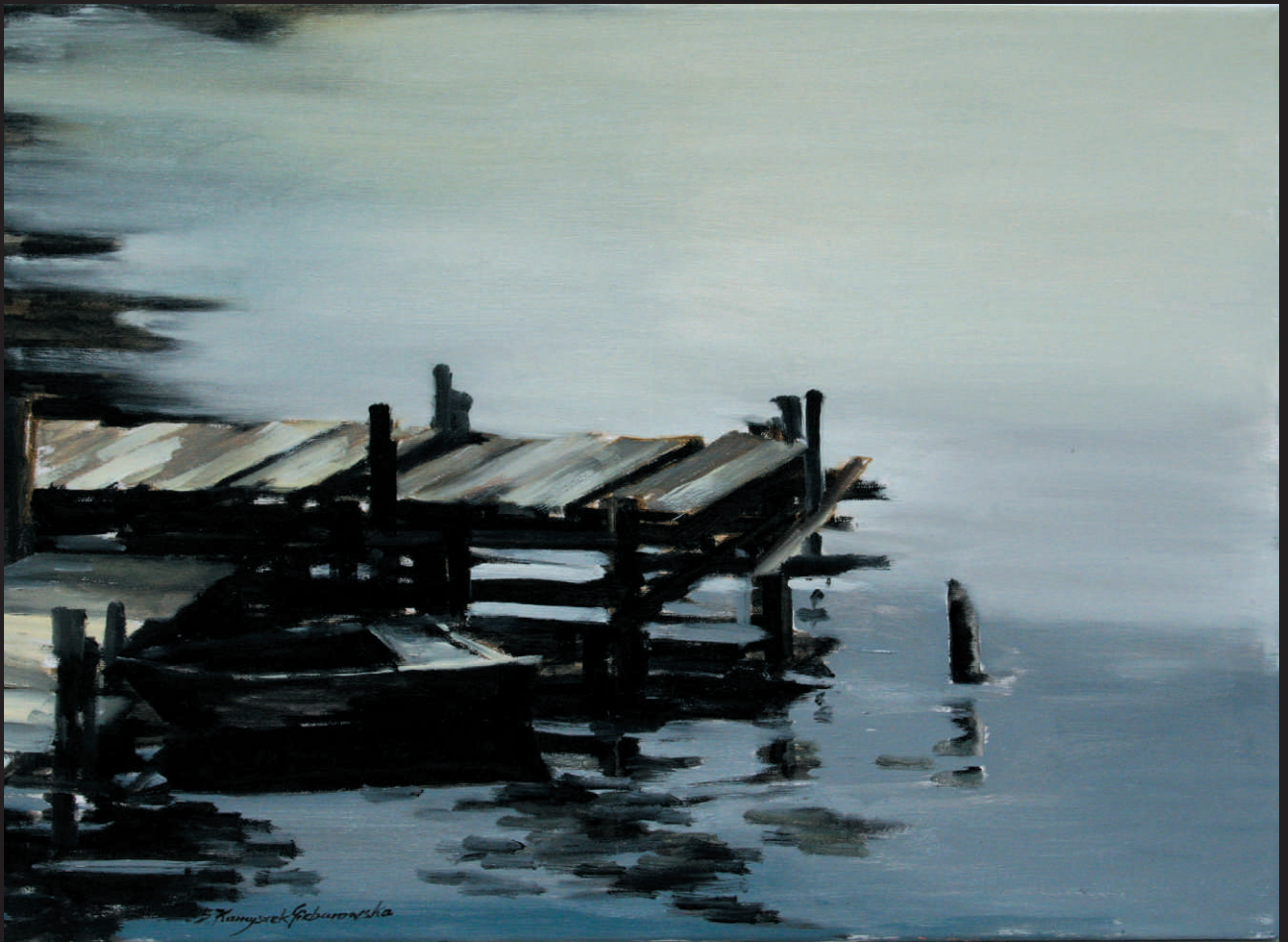
BARBARA KAMYSZEK GIEBUROWSKA „JEZIORO W SKOKACH”, ol./pt., 60 x 70 cm, 2015