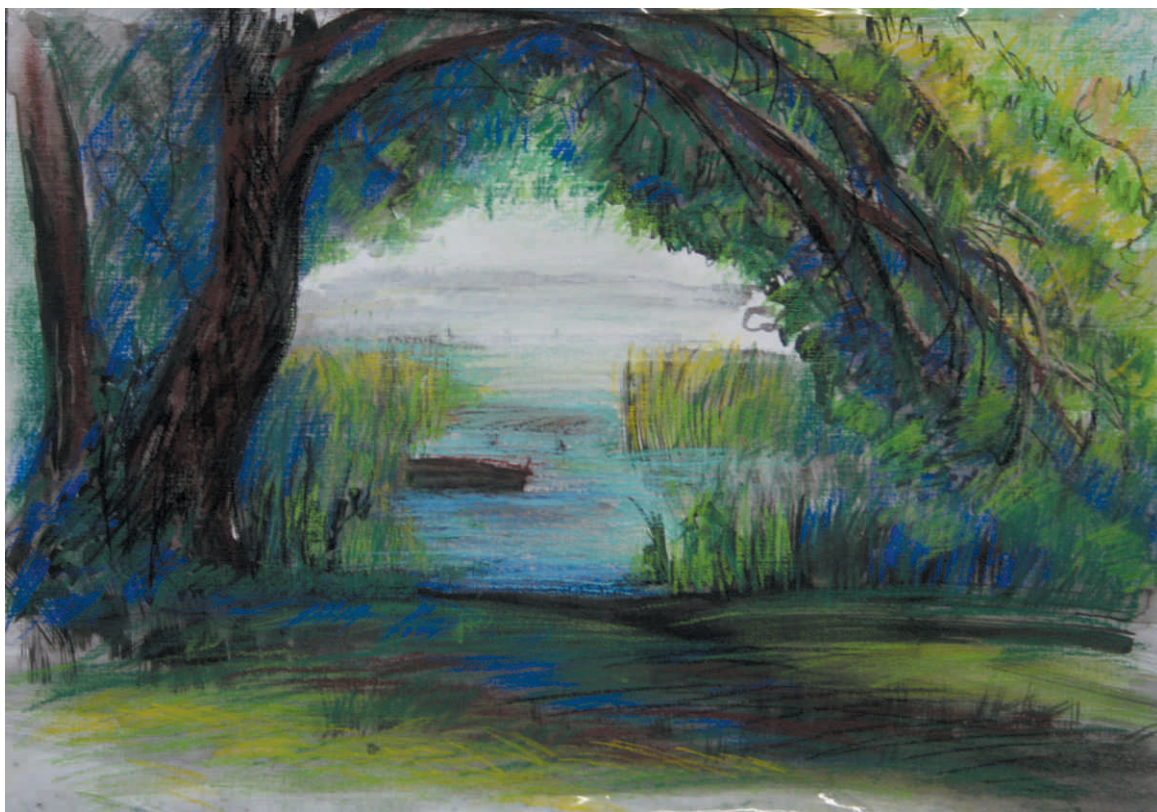
NATALIA JÓZEFOWNA TOŁOCZKO „JEZIORO W SKOKACH”, akwarela/papier, 30 x 40 cm, 2015