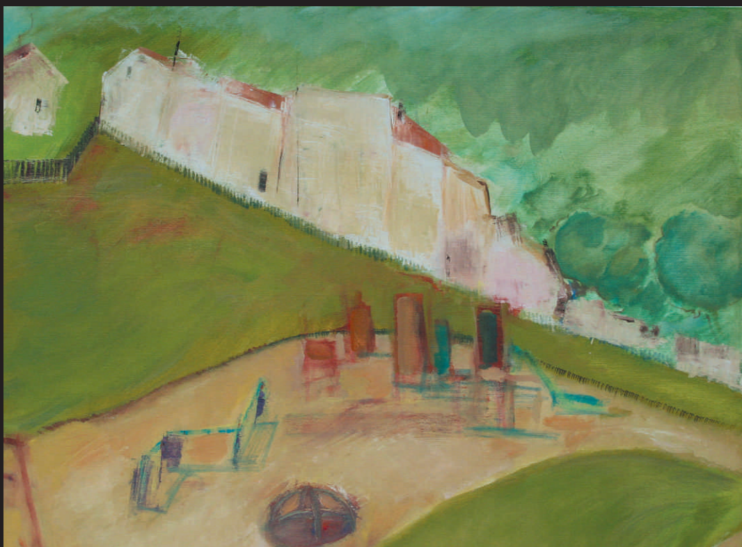
BOLESŁAW MUSIEROWICZ „PLAC ZABAW DZIECIĘCYCH”, ol./pł., 70 x 80 cm, 2015