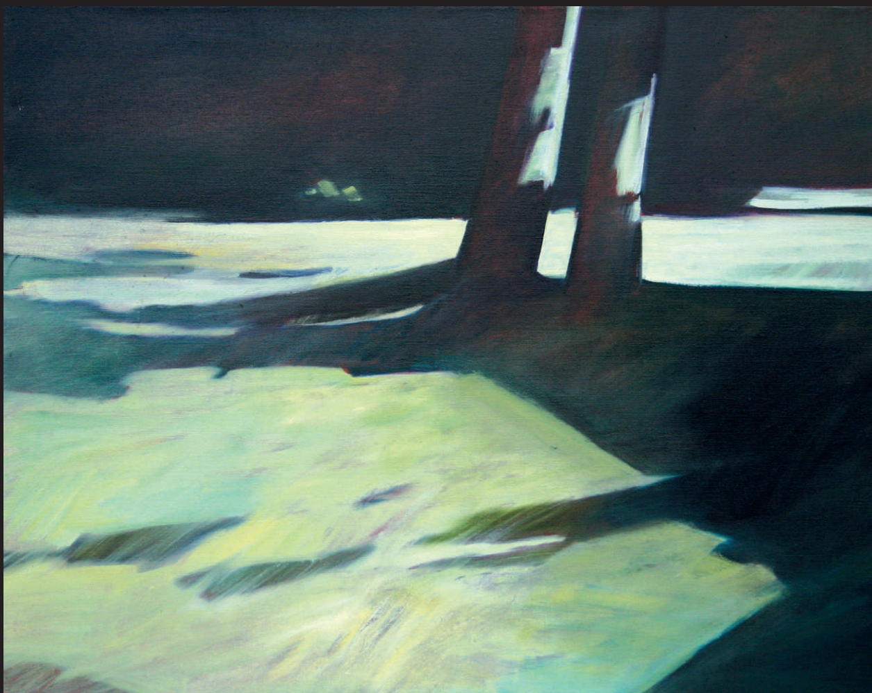
WALDEMAR M. IDZIKOWSKI „CHIAROSCURO IV”, ol/pt, 73 x 92 cm, 2015