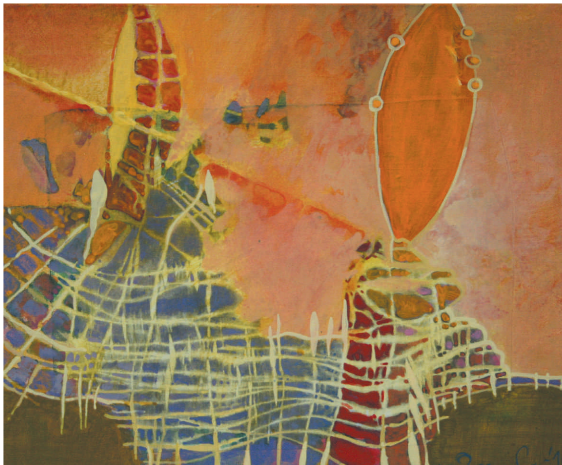
WOŁODYMYR CZORNOBAJ „UPALNE GRANIE”, pastel, akryl/pł., 40 x 50 cm, 2015