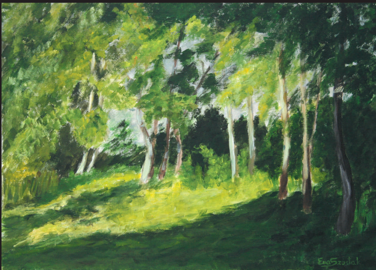
EWA SZOSTAK „W SŁOŃCU”, akr./pt., 50 x 70 cm, 2015