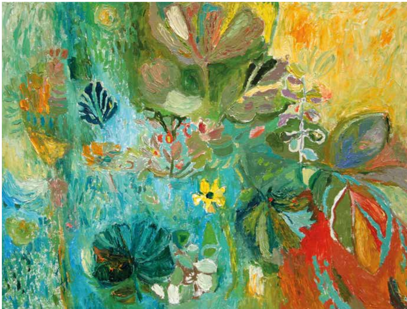
ŻÓŁTONIEBIESKI, 60x80 cm, olej/płótno