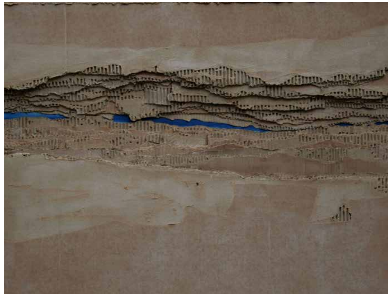
Z cyklu FRAGILE–EPIZOD I, 70×90 cm, technika wł.