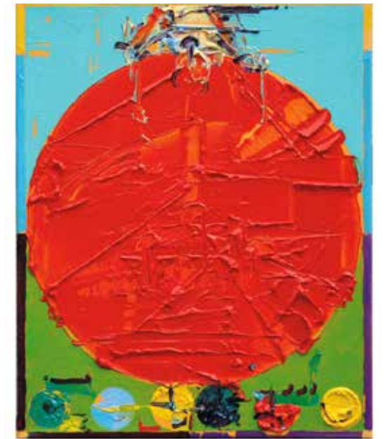
TRYPTYK: CZERWONY PYŁEK, ŻÓŁTY PYŁEK, NIEBIESKI PYŁEK, 50x40 cm, olej/płótno