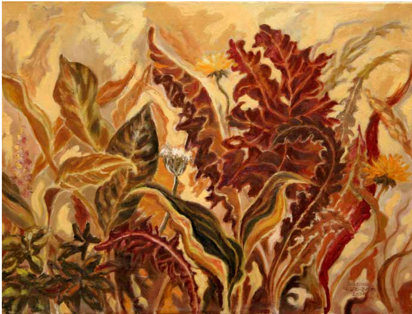
LIŚCIE, 50x70 cm, olej/płótno

Ukończyła studia plastyczne na Wydziale Sztuk Pięknych Uniwersytetu Mikołaja Kopernika w Toruniu i uzyskała dyplom w zakresie malarstwa i pedagogiki artystycznej. Wystawia od 1976 roku. Jest członkiem Związku Polskich Artystów Plastyków, Stowarzyszenia Marynistów Polskich, Stowarzyszenia Twórców i Sympatyków Kultury oraz EKOART-u. Uczestniczyła w ponad 300 wystawach zbiorowych na terenie kraju oraz w Kilonii i Londynie. Indywidualnie swoje prace wystawiała w Łodzi, Gnieźnie, Koninie, Gdyni, Mogilnie, Zielonej Górze, Wormacji (Niemcy) oraz wielokrotnie w Poznaniu. Zajmuje się malarstwem sztalugowym, na jedwabiu oraz rysunkiem i fotografią. Od ponad 40 lat pracuje jako instruktor plastyki w Młodzieżowym Domu Kultury nr 1 w Poznaniu. Przez 17 lat prowadziła tam galerię „Pod Arkadami”, w której promowała twórczość plastyczną nauczycieli oraz dzieci i młodzieży. Od kilku lat jest organizatorem plenerów plastycznych. Jej prace znajdują się w zbiorach prywatnych w Europie, Stanach Zjednoczonych i Indiach.