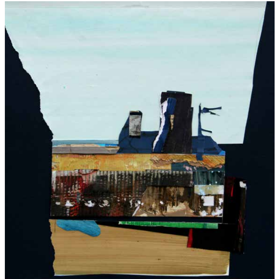
W POLU, 50×50 cm, technika mieszana na papierze