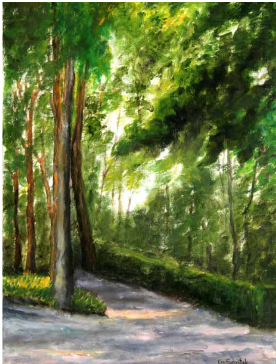
PARK W SKOKACH, 70×50 cm, olej/płótno