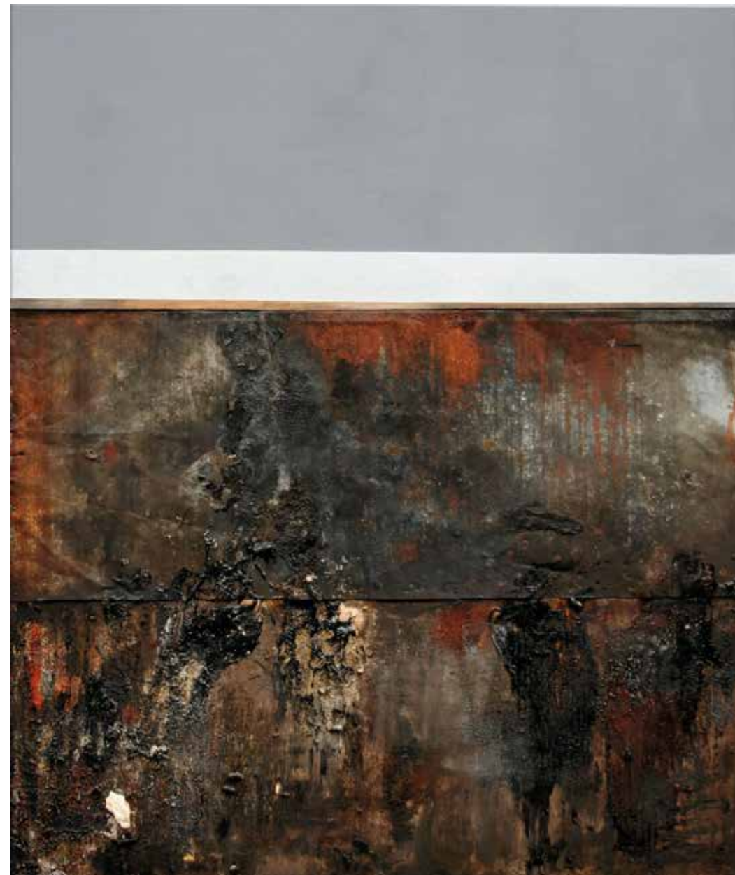
DESTRUKCJA IV, 120×100 cm, technika wł.