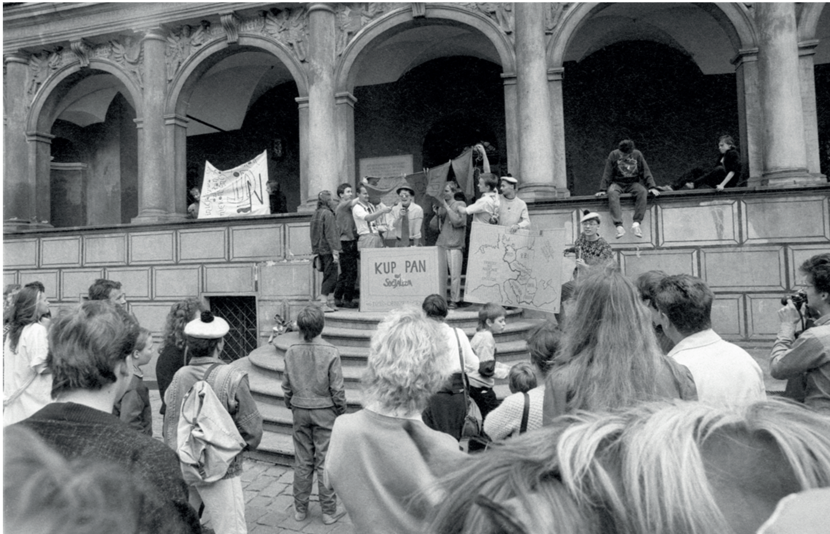
ANDRZEJ SZOZDA /MIASTO ŻYWE/

Happening „Kup pan socjalizm”, Stary Rynek, 1989 r.