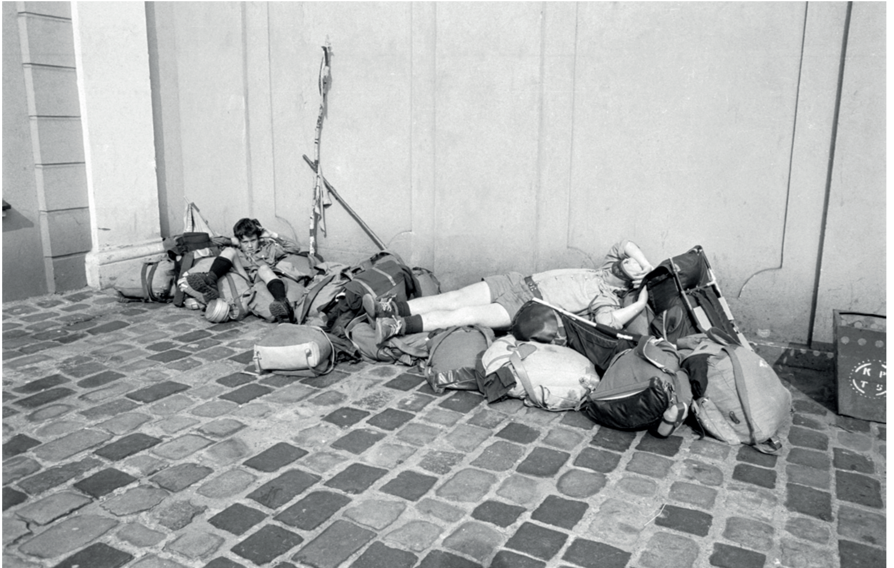
ANDRZEJ SZOZDA / MIASTO ŻYWE /

Harcerze na Starym Rynku, lata 80. XX w.