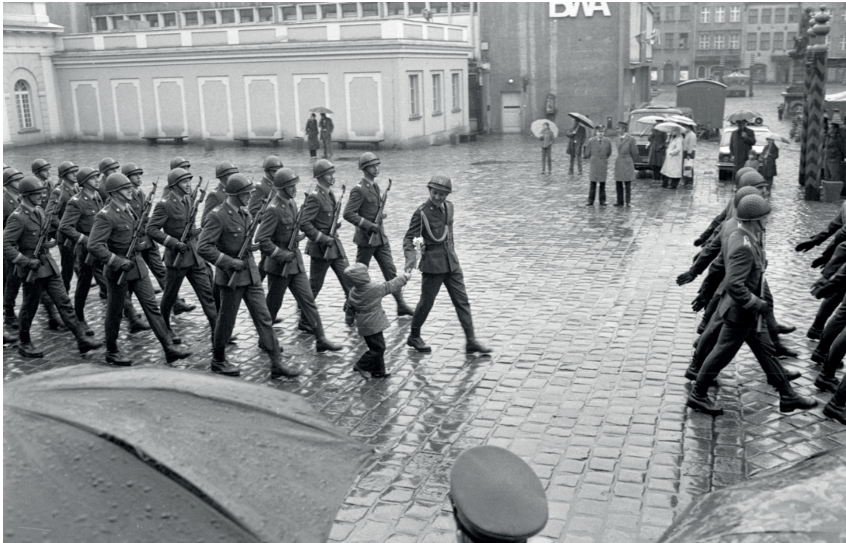
ANDRZEJ SZOZDA / MIASTO ŻYWE /

Odprawa wart przed Odwachem na Starym Rynku, 1980 r.