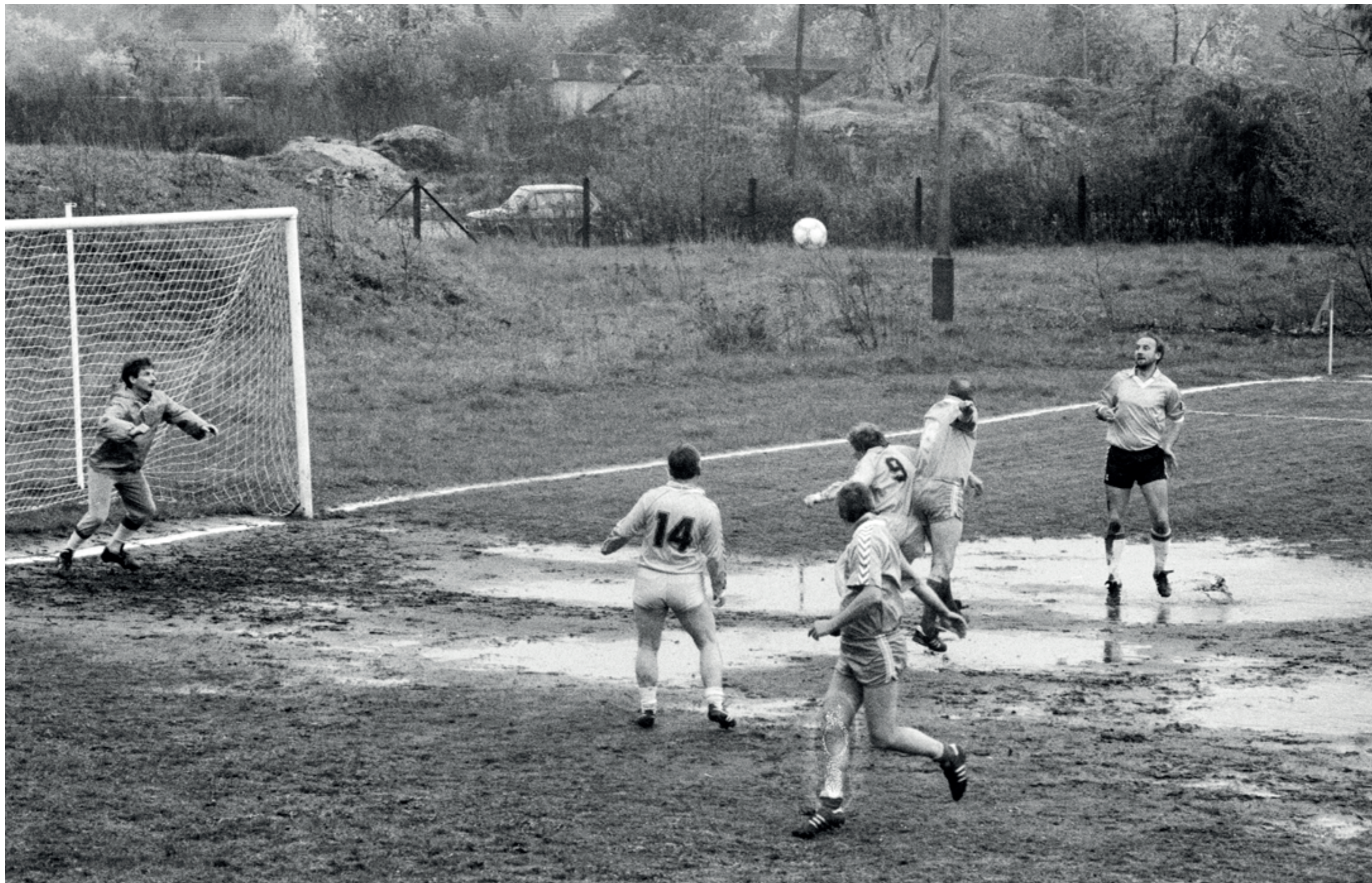
ANDRZEJ SZOZDA /MIASTO ŻYWE/

Mecz piłkarski na boisku TKKF na Winogradach, 1993 r.