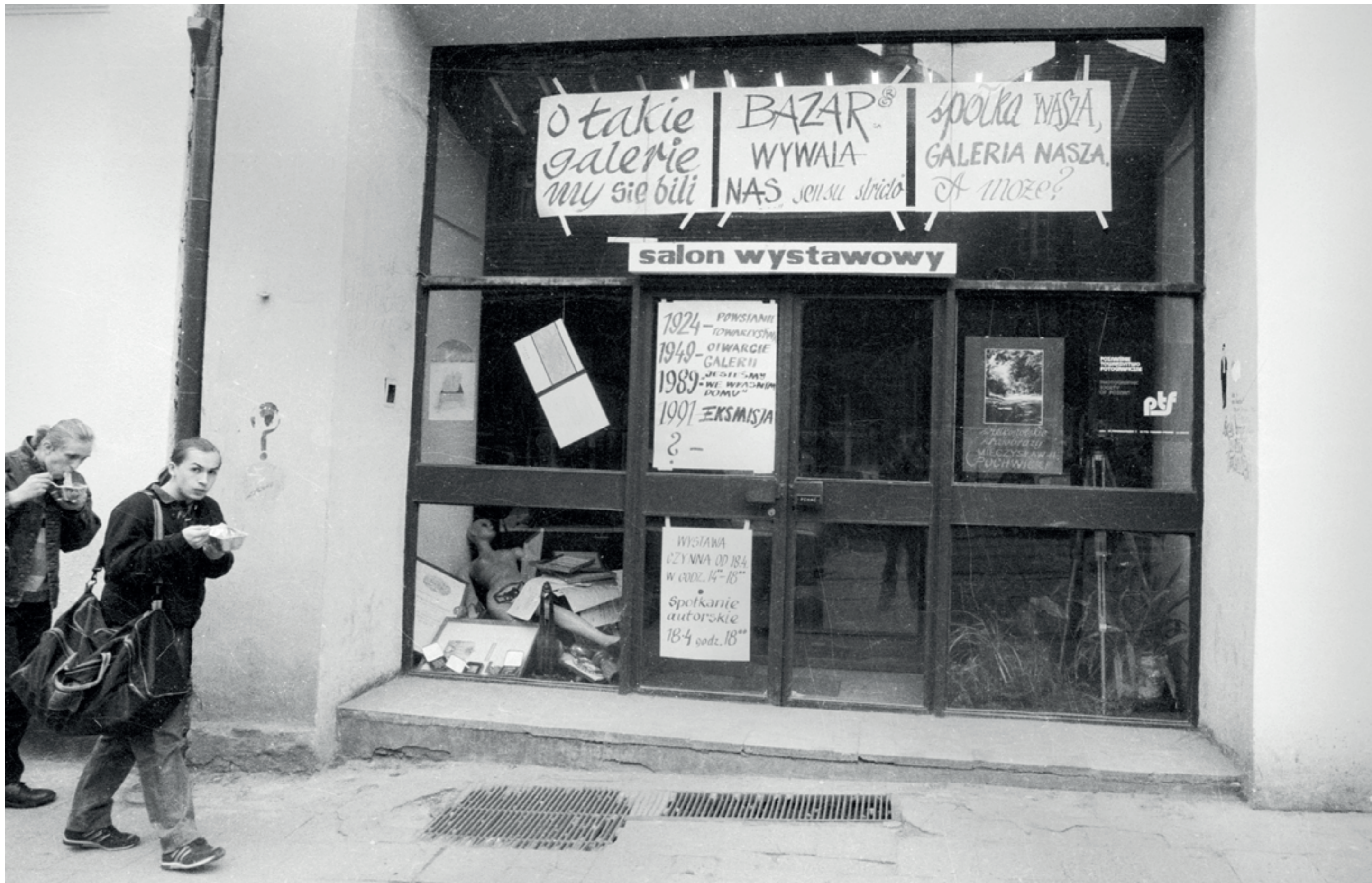
ANDRZEJ SZOZDA / MIASTO ŻYWE /