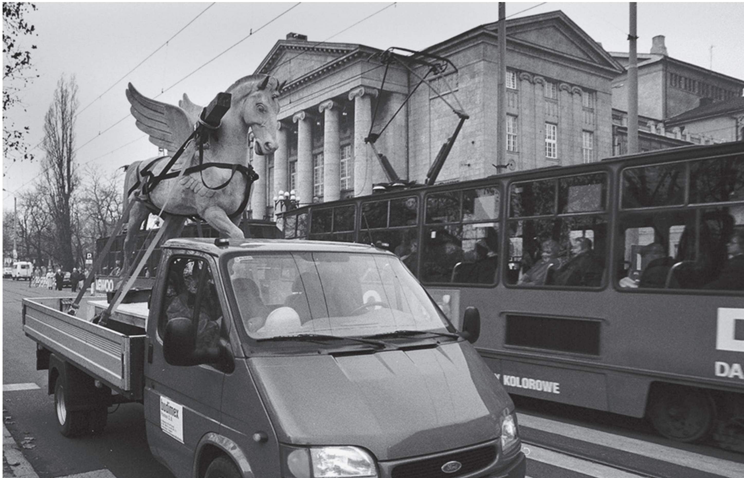
ANDRZEJ SZOZDA / MIASTO ŻYWE /

Transport Pegaza z tympanonu Opéry do pracowni konserwatorskiej, 27 listopada 1997 r.