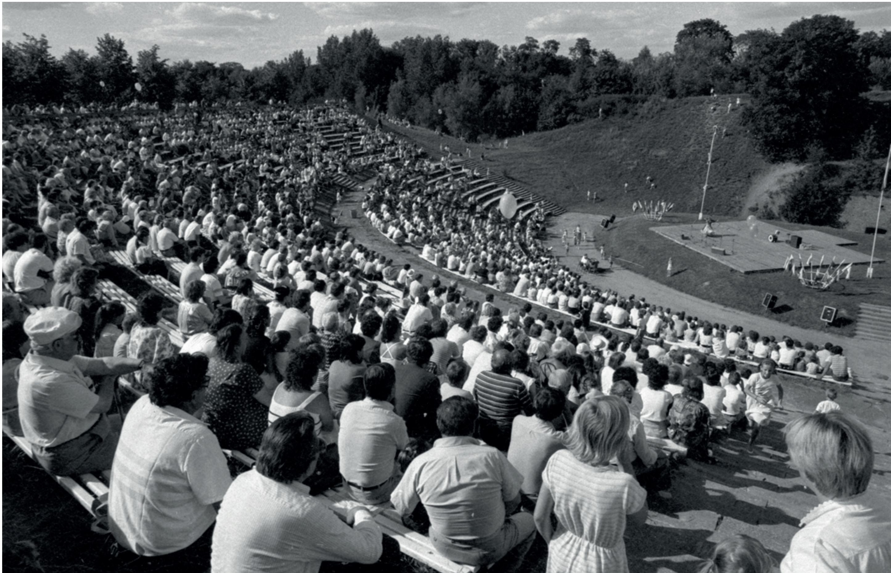
ANDRZEJ SZOZDA / MIASTO ŻYWE /