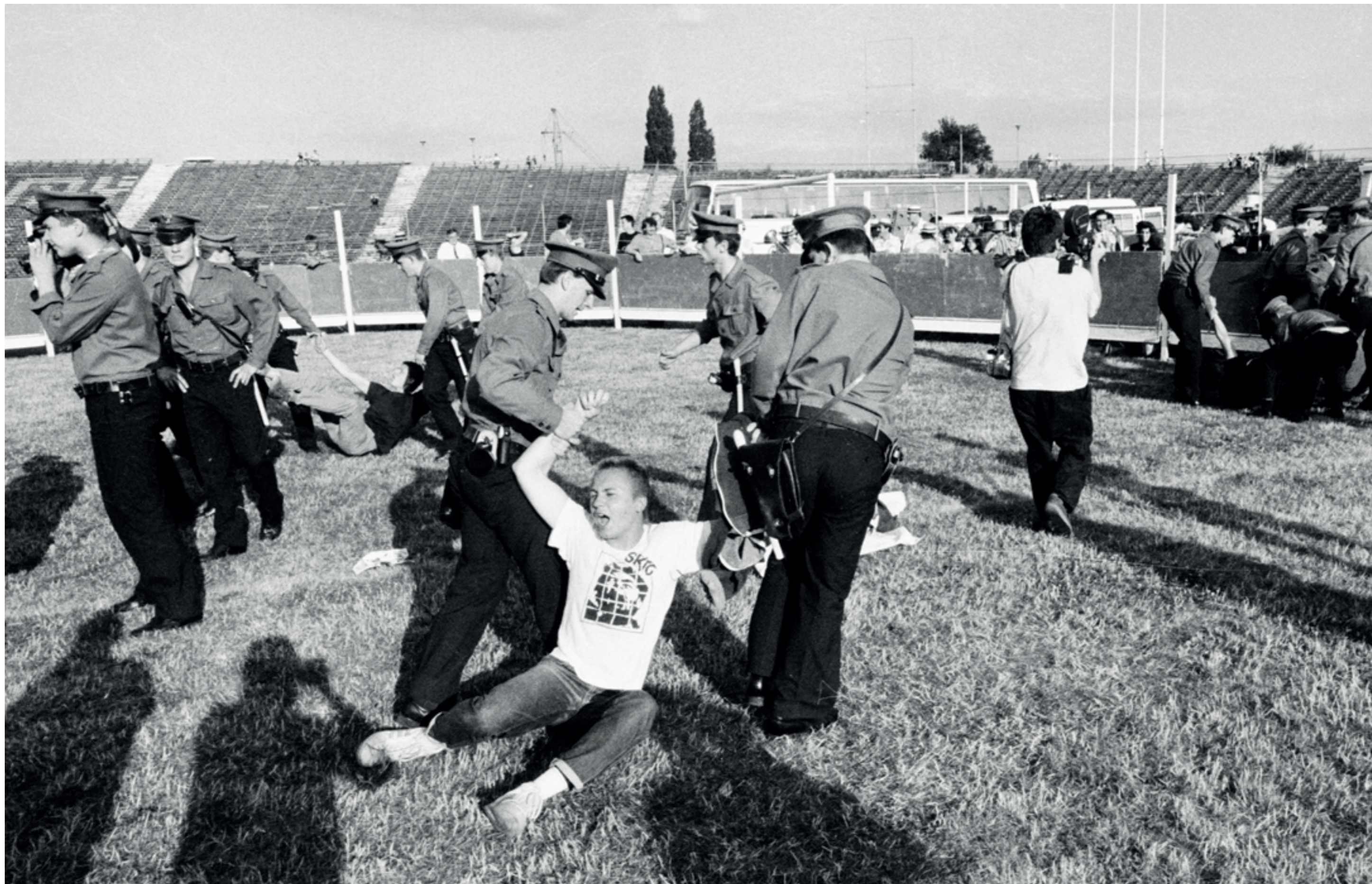
ANDRZEJ SZOZDA /MIASTO ŻYWE/

Policja usuwa z murawy stadionu Warty obrońców zwierząt protestujących przed pokazem corridy, 29 lipca 1991 r.