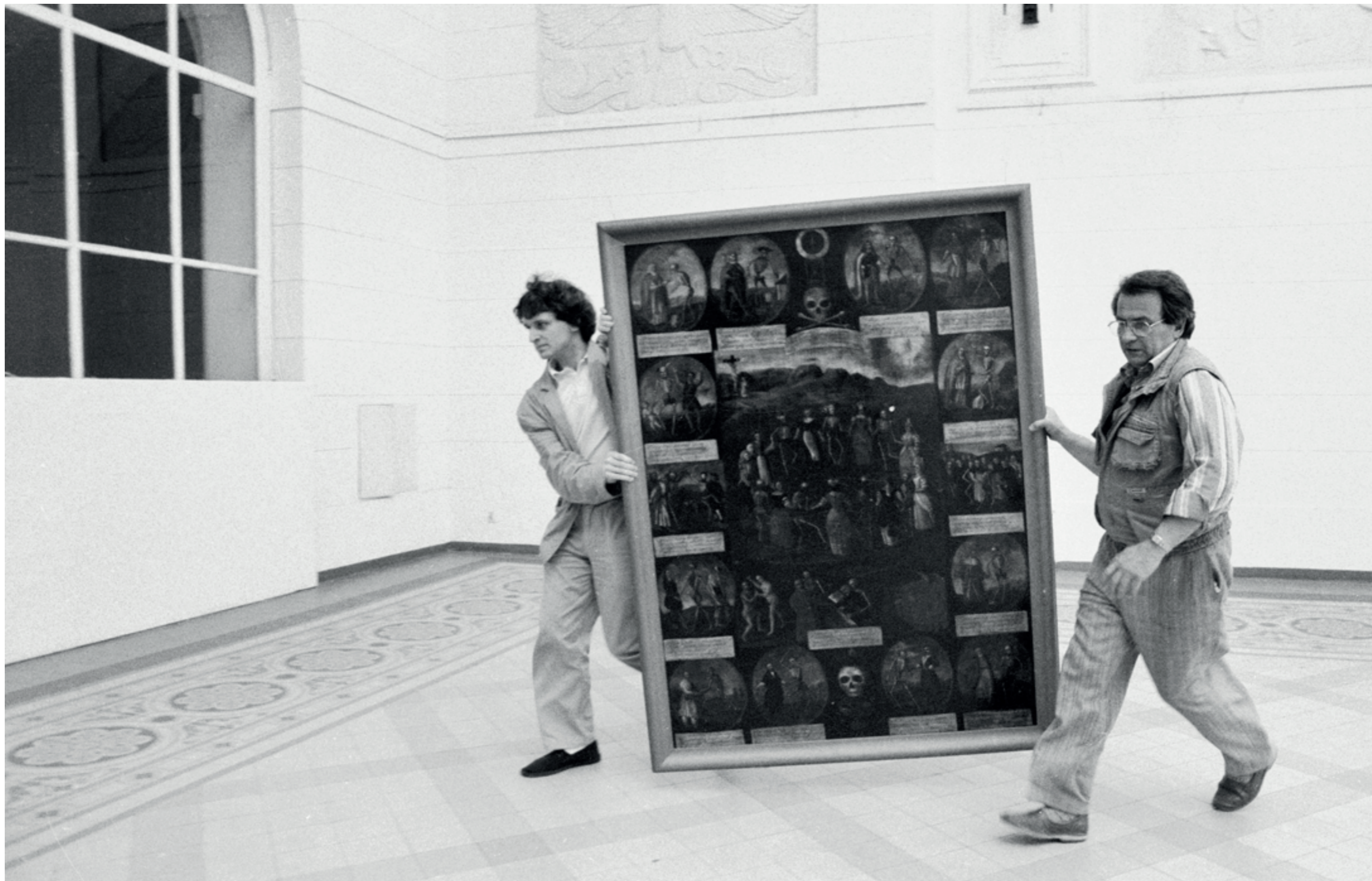
ANDRZEJ SZOZDA / MIASTO ŻYWE /

Ratowanie zbiorów w czasie pożaru gmachu Muzeum Narodowego, czerwiec 1991 r.