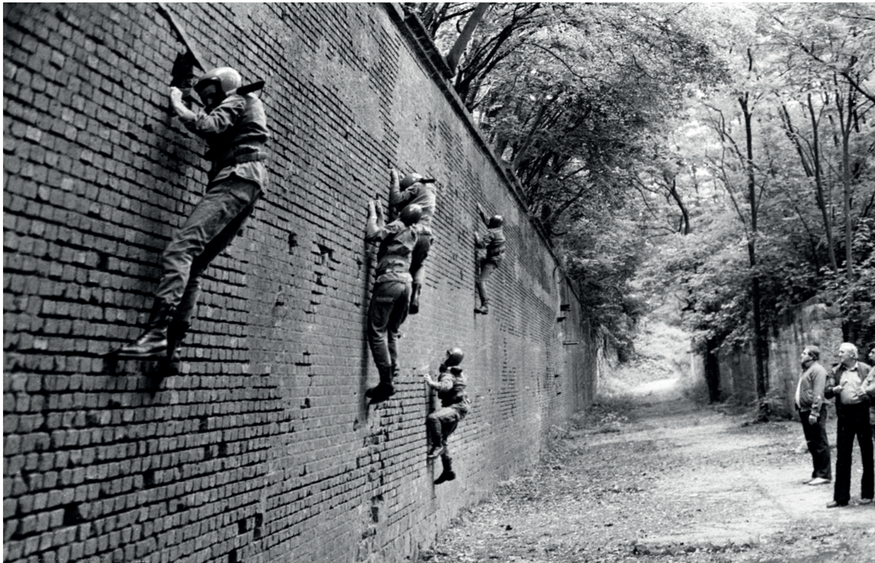
ANDRZEJ SZOZDA / MIASTO ŻYWE/

Ćwiczenia wojsk powietrznodesantowych, lata 80. XX w.