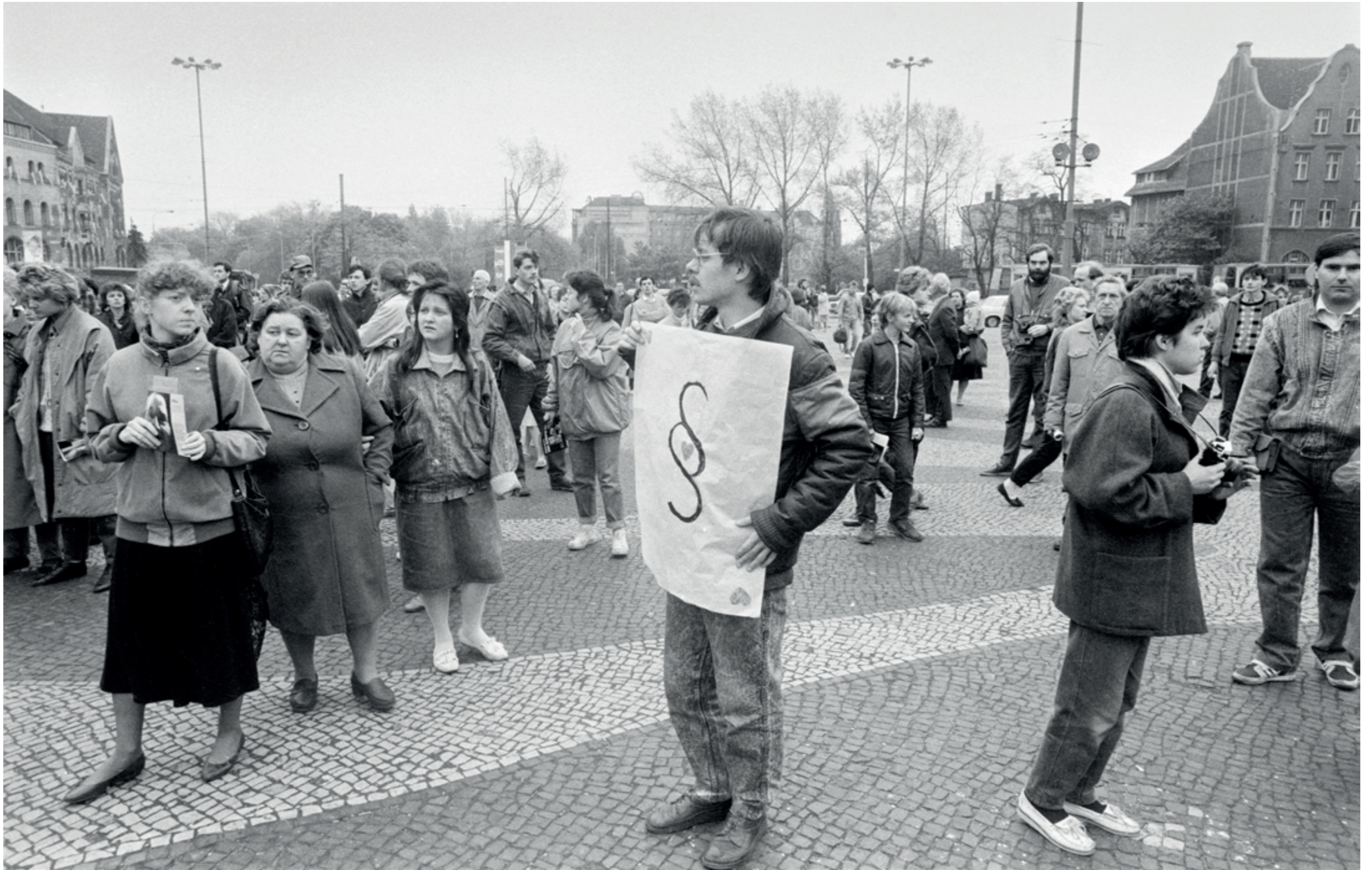
ANDRZEJ SZOZDA /MIASTO ŻYWE/

Manifestacja antyaborcyjna, pl. Mickiewicza, 1989 r.