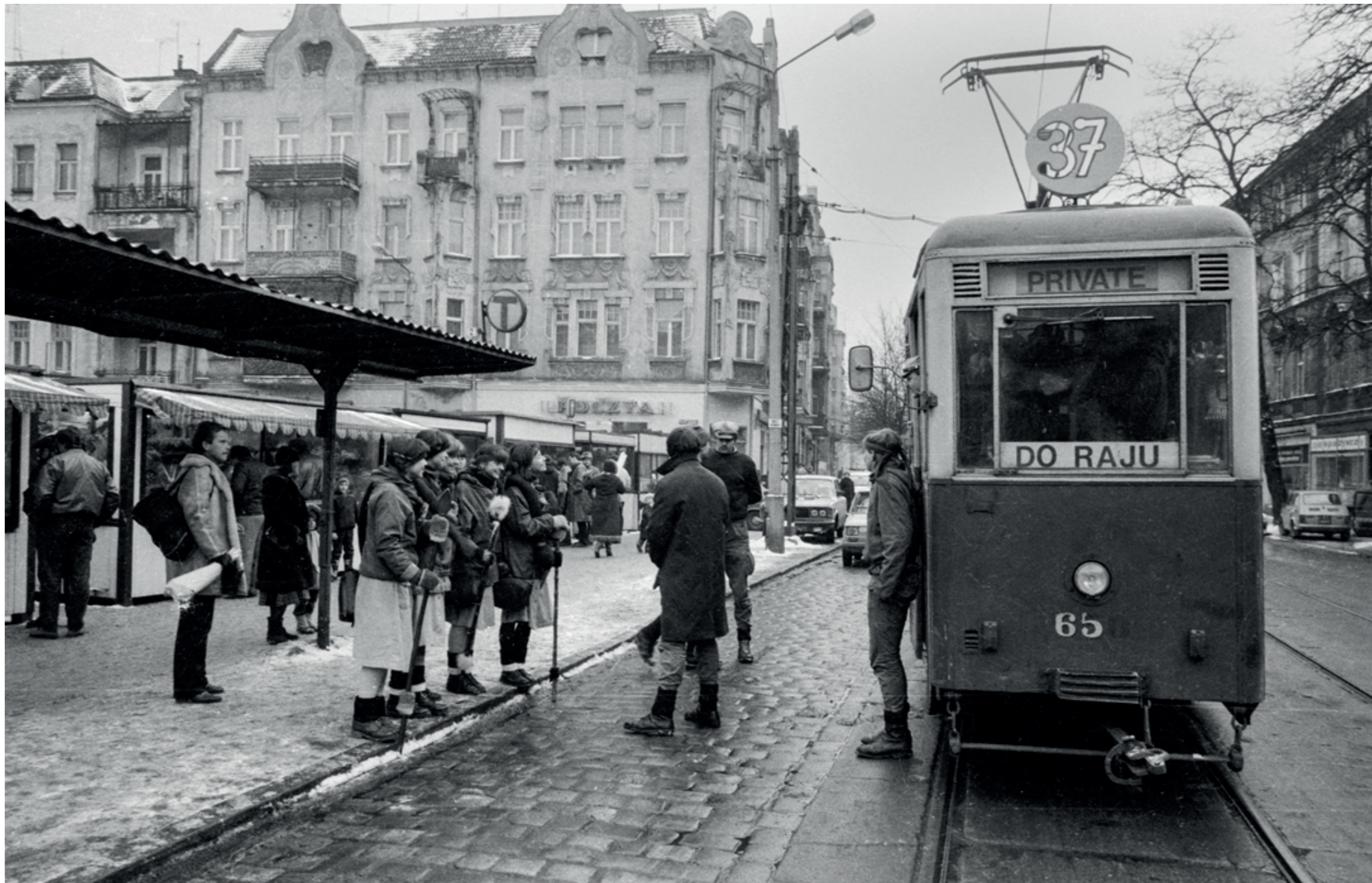
ANDRZEJ SZOZDA / MIASTO ŻYWE /