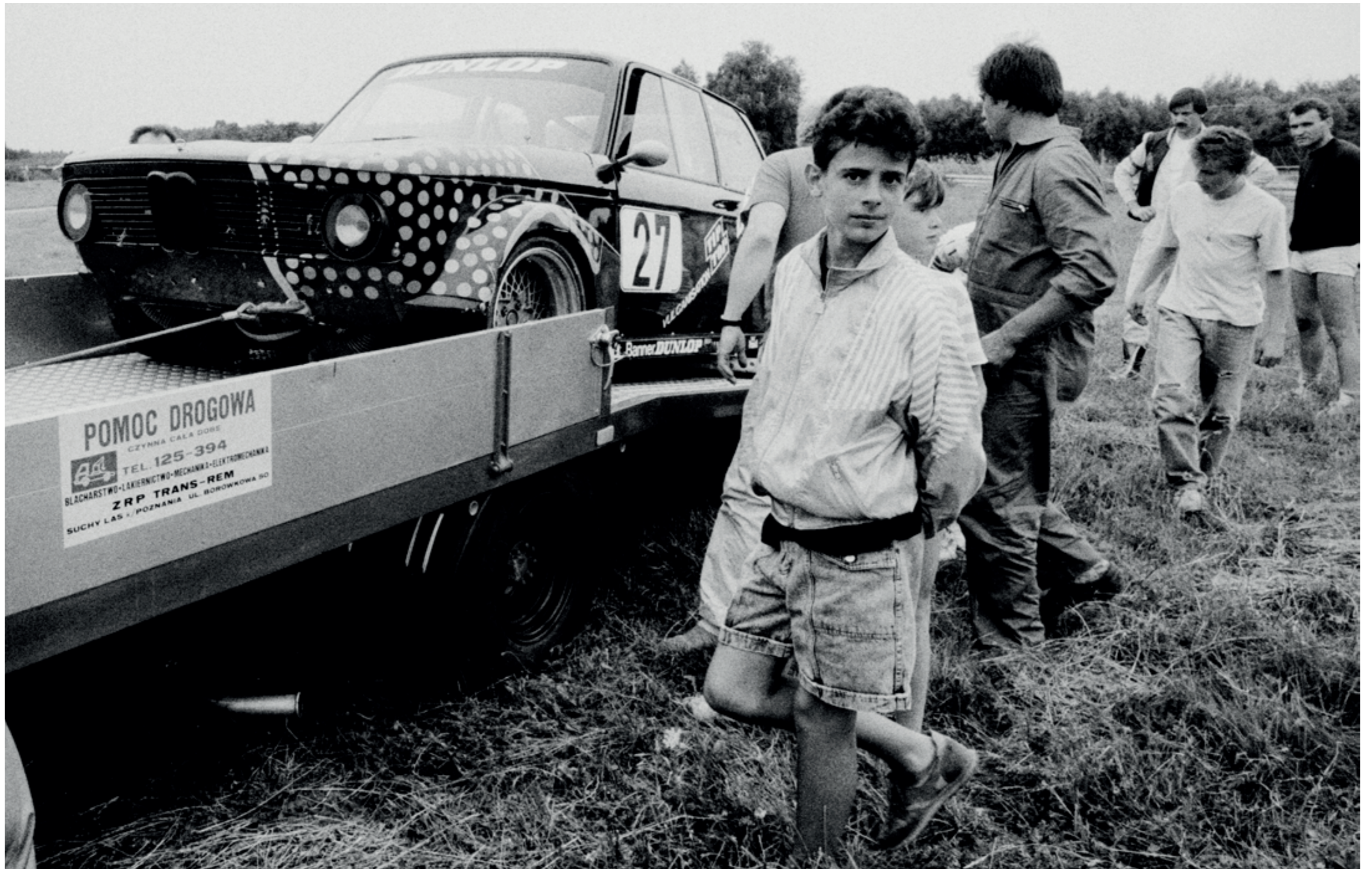
ANDRZEJ SZOZDA / MIASTO ŻYWE /

Wyścigi samochodowe na Torze Poznań, 1991 r.