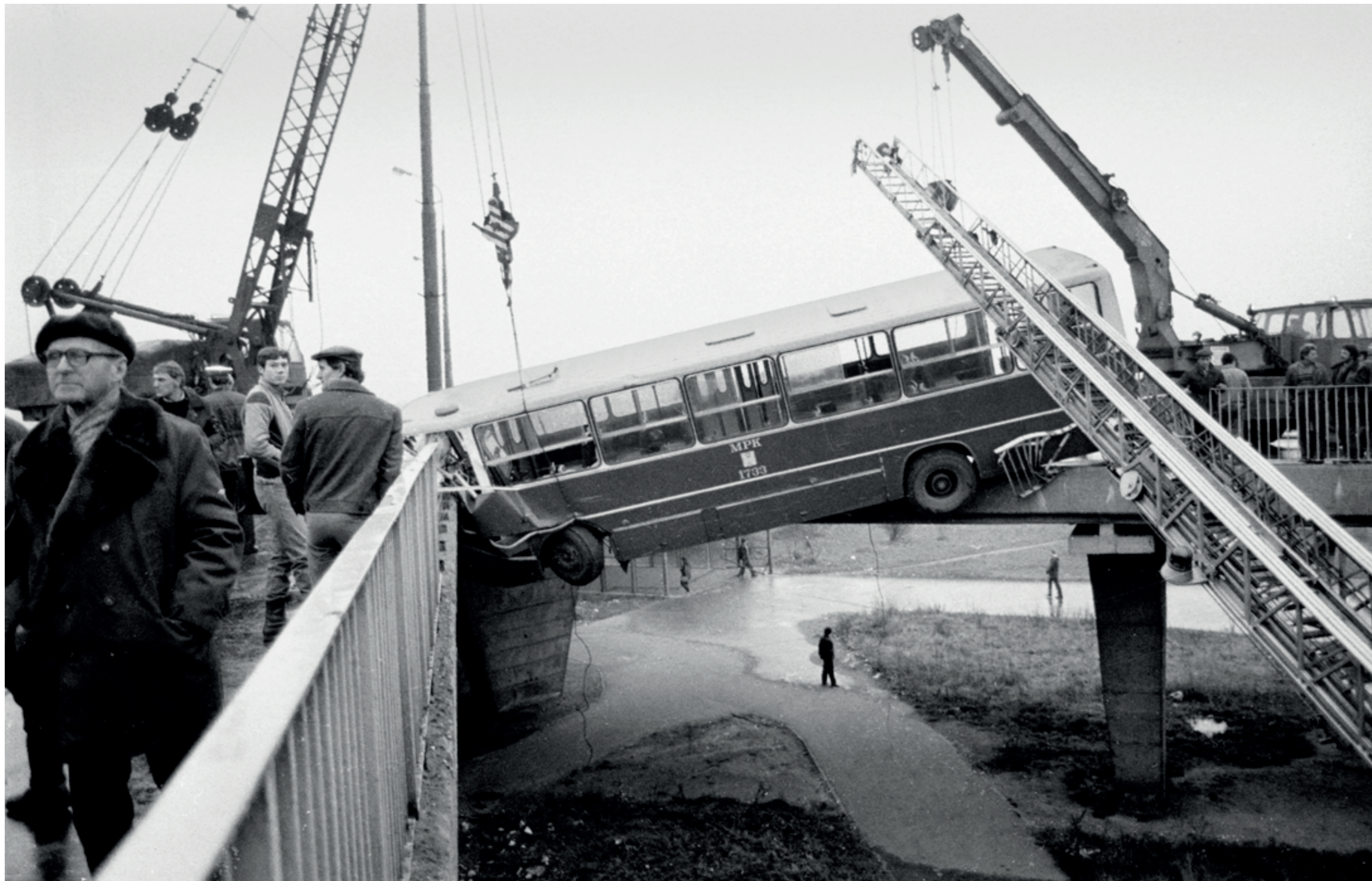
ANDRZEJ SZOZDA /MIASTO ŻYWE/