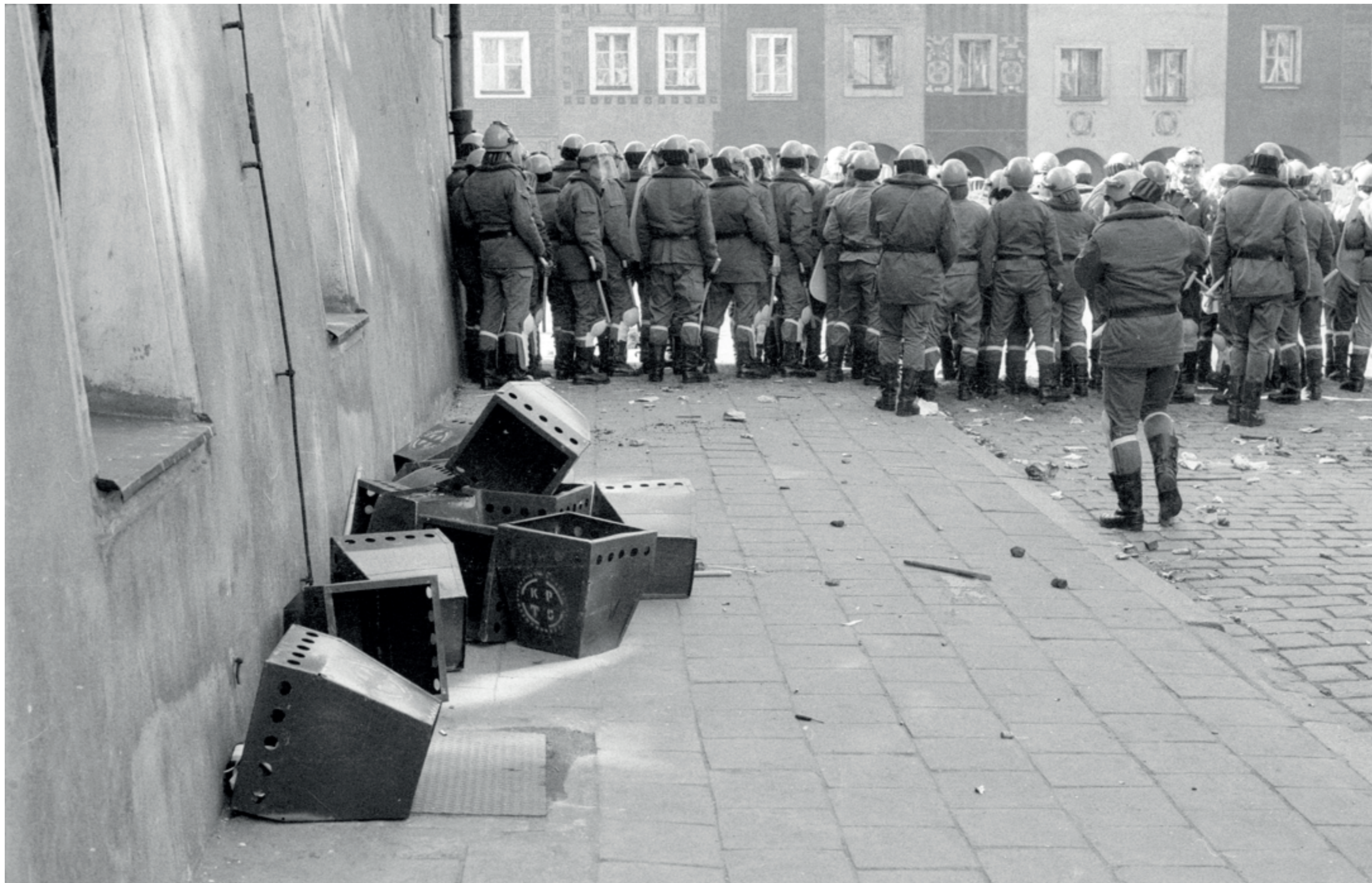
ANDRZEJ SZOZDA /MIASTO ŻYWE/

Oddziały ZOMO pacyfikujące pokojową demonstrację przeciwko budowie elektrowni atomowej Warta w Klempiczu, Stary Rynek, 2 kwietnia 1989 r.