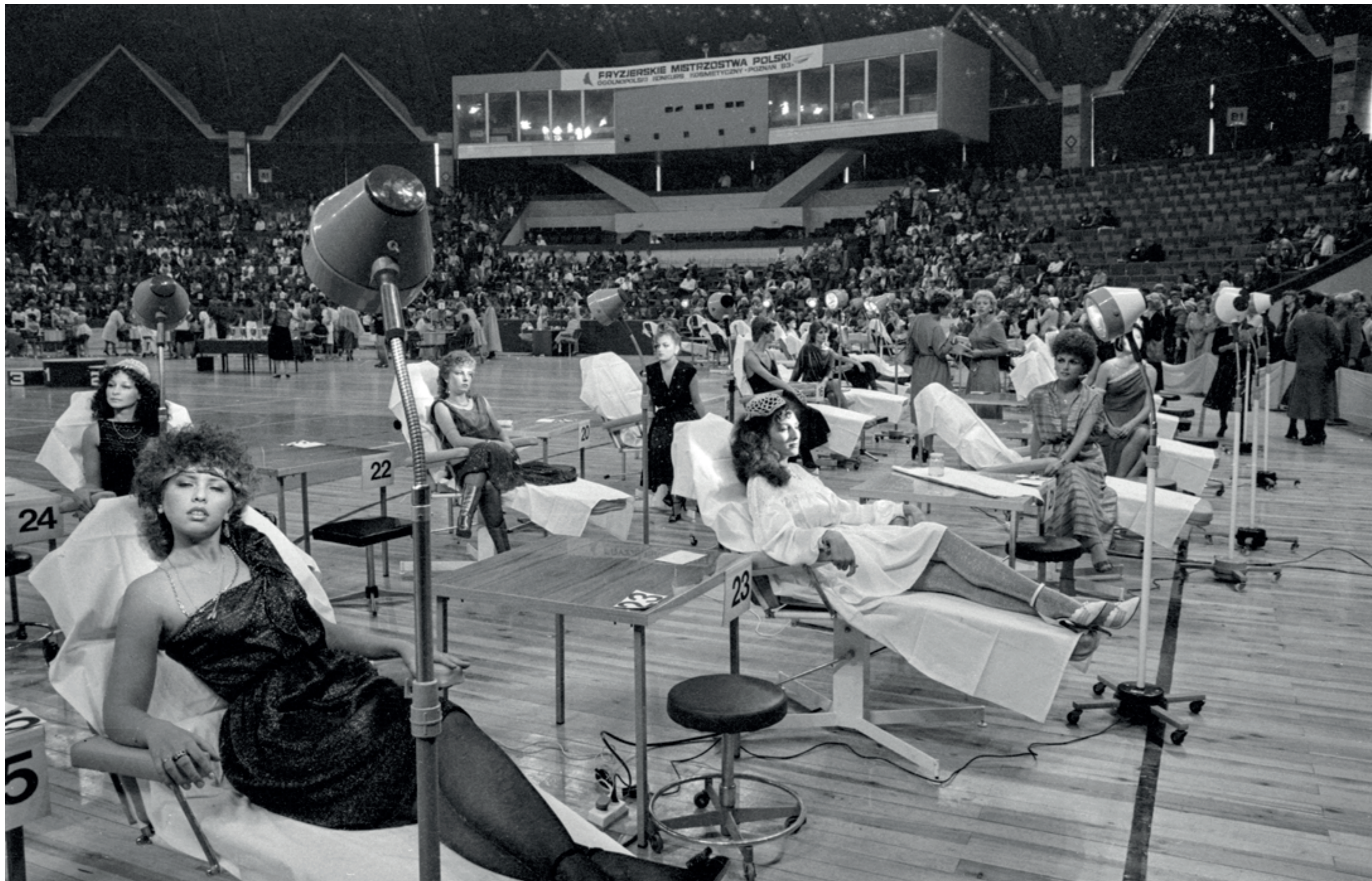
ANDRZEJ SZOZDA / MIASTO ŻYWE /