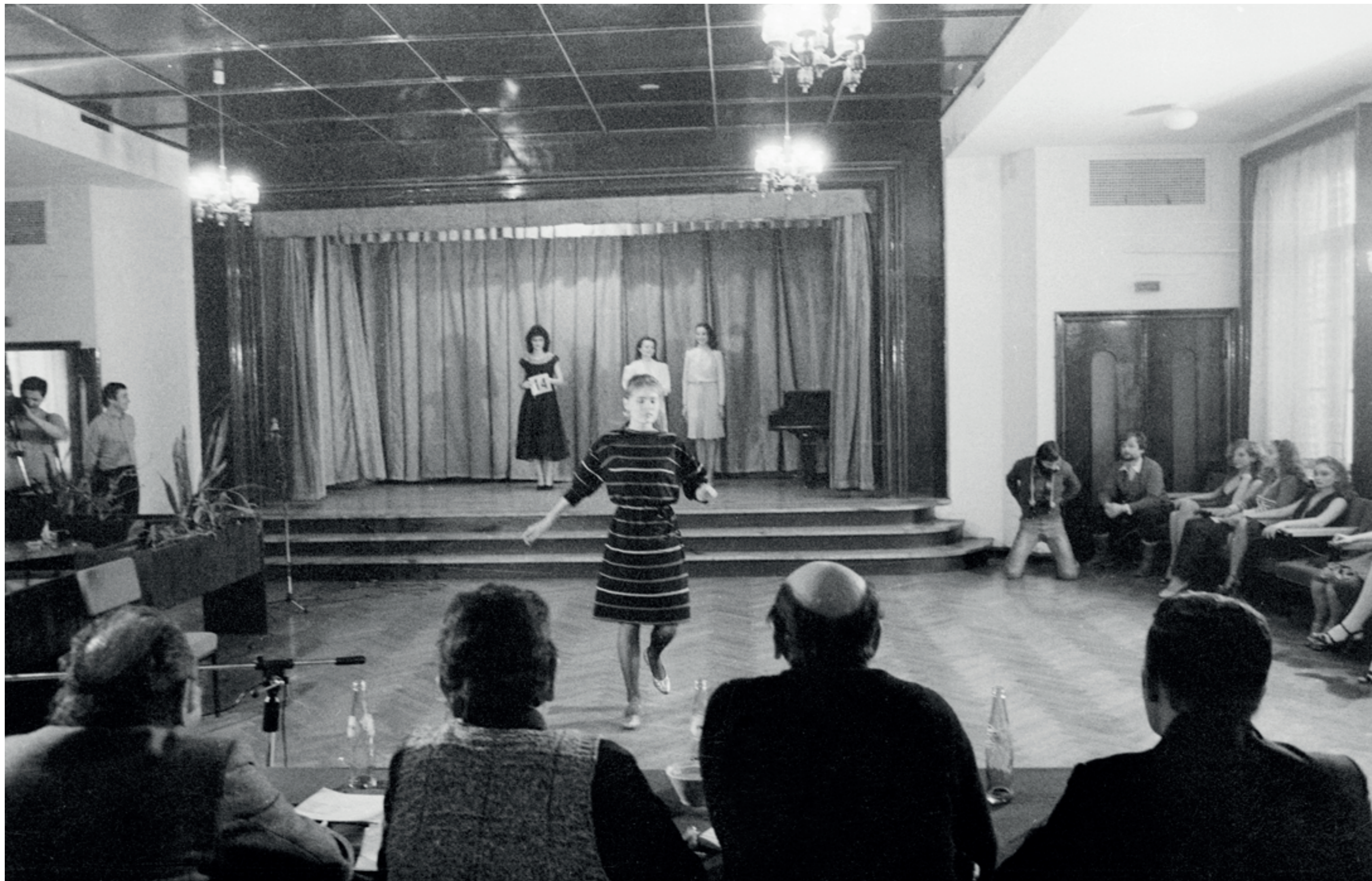
ANDRZEJ SZOZDA / MIASTO ŻYWE /