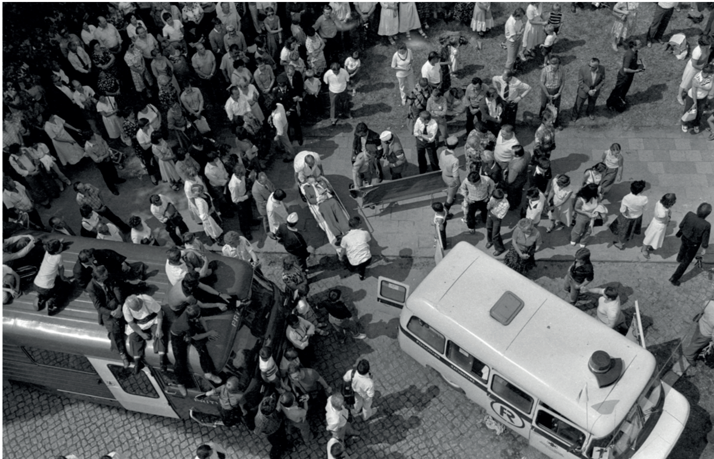
ANDRZEJ SZOZDA / MIASTO ŻYWE /