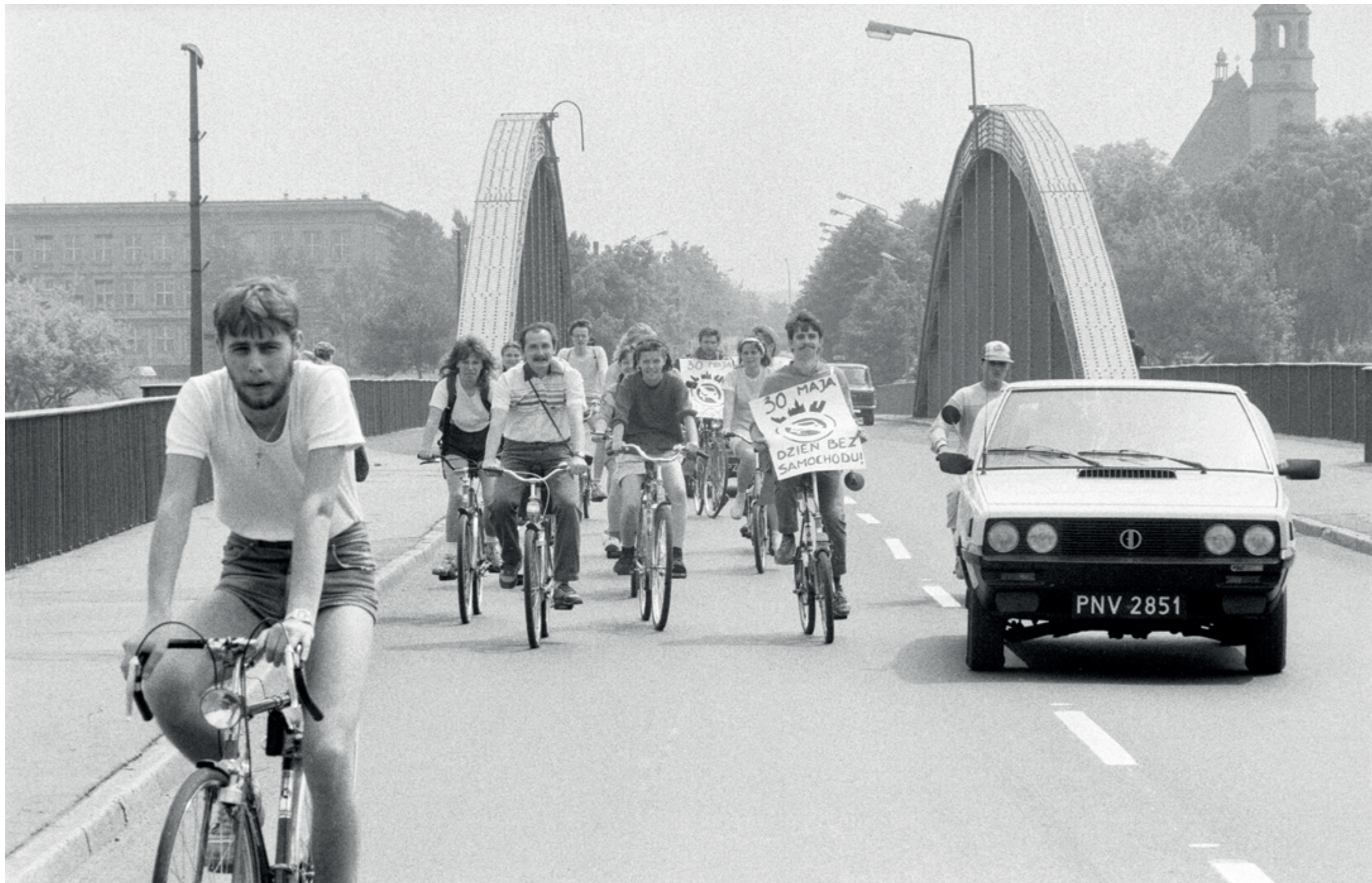
ANDRZEJ SZOZDA / MIASTO ŻYWE /