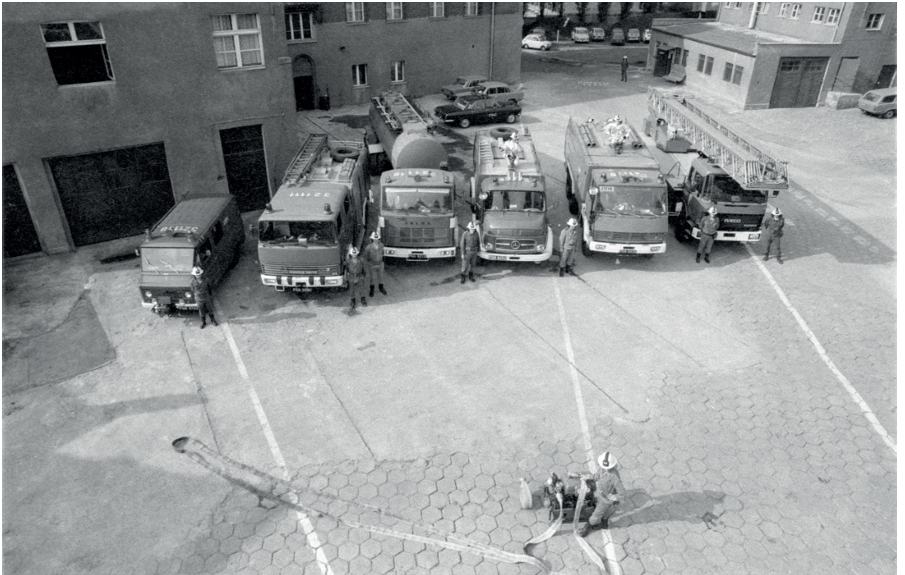
ANDRZEJ SZOZDA /MIASTO ŻYWE/